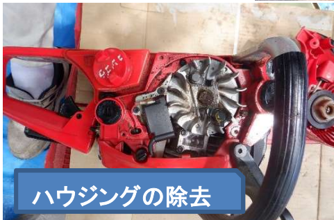
ハウジングの除去