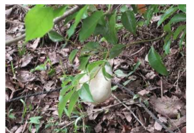
モリアオガエルの卵