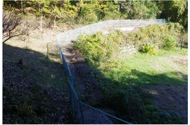
フェンス近傍の草刈

10月27日(日)の定例作業は雑木林の下草刈りでした。特に、遊具広場脇の雑木林下部にある公園の境のフェンスにはツルが絡み付き雑草や竹が生えて非常に荒れた状態でした。今回、写真にあるようにきれいになりスッキリしました。