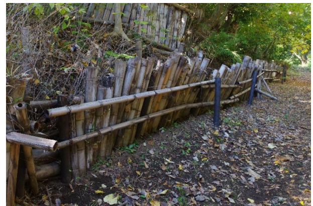
遊具広場脇の土留め柵の仮補修

11月17日(日)の雑木林塾の梅の剪定時に柵の補修の他、梅林上部の枯れ木を1本伐採し処理しました。