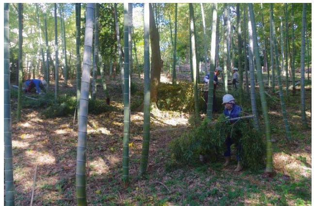
竹林の清掃と竹の間伐

は快調に作動し、枯枝や竹の枝葉をつけた部分を全てチップにし竹林に撒きました。チップパーは既に15年近く使っており、昨年から今年にかけて故障が多く修理してきましたが、何とか正常に作動するようになりました。これから来年3月にかけて竹林の竹の間伐や雑木林の復元のために竹の皆伐を行います。そこでチップパーが大活躍します。しかし、騒音が出るので林の中や防音ボードなどで遮音しできるだけ音を小さくしながら使う必要があります。