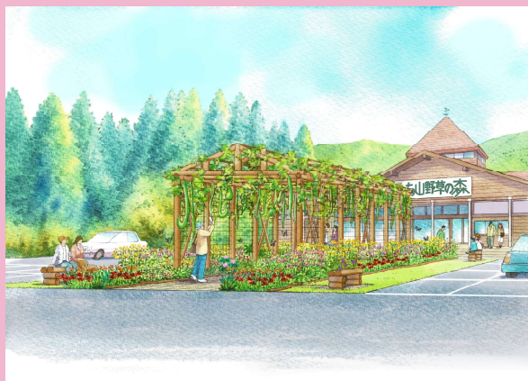
第35回 都市緑化機構賞 一般財団法人和知ふるさと振興センター