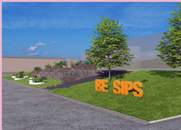
第35回 国土交通大臣賞 社会福祉法人樟櫛会

地域のシンボリックな緑地として人と自然が共生する都市環境の形成、地域の活性化に寄与するプランを募集します。