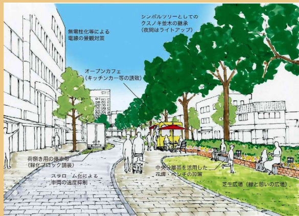
第35回 国土交通大臣賞 一般社団法人市駅グリーンプロジェクト

日常的な花や緑の活動を通して、地域の活性化や子どもたちへの情操教育、身近な環境の改善に寄与するプランを募集します。